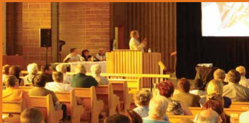
Consultation publique du 7 juin 2011 à l'église Saint-Paul où 300 citoyens et acteurs du milieu étaient réunis.

En 2020, Beauharnois est en voie de devenir un des milieux riverains les plus achalandés et convoités du Grand-Montréal. En 2012, Beauharnois s'est dotée d'un plan d'action en développement durable orienté vers l'avenir, son Plan directeur Beauharnois 20/20. Elle s'est inspirée d'une perspective vraisemblable et optimiste sur l'avenir de la Ville, fondée sur le changement et l'innovation. Elle a mis de l'avant de nouveaux concepts de développement et d'aménagement qui favorisent une meilleure qualité de vie pour tous les citoyens, sans distinction. Elle a mis en valeur ses attraits et a tiré avantage des opportunités qui se sont présentées à elle, dont le parachèvement de l'Autoroute 30 et les changements démographiques que celle-ci laisse entrevoir. La Ville n'a pas travaillé seule : elle a eu le souci d'impliquer l'ensemble de sa population, autant les industriels et les commerçants, que les travailleurs, parents et étudiants.